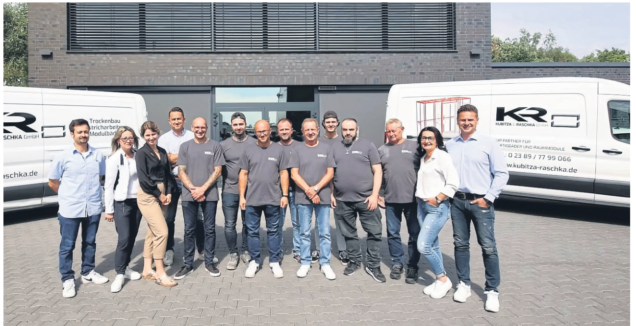
Das Team der Kubitza & Raschka GmbH deckt in Sachen Innenausbau von Estrich über Beton- und Trockenbau- bis zu Malerarbeiten und der Fertigung von Gebäuden in Modulbauweise alle Bereiche ab.